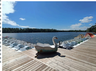
©Le Ponton des Lacs de Laives