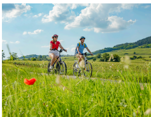
© DSL 71 / Robert-Famy Guillaume